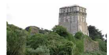
Le donjon du château de Trémazan.

Situé dans un site mystérieux et légendaire, les ruines de l'ancienne forteresse se dressent majestueusement face à la mer. Héritage du XIV e siècle, il constitue un « témoignage rare sur l'architecture militaire et seigneuriale en Bretagne. »