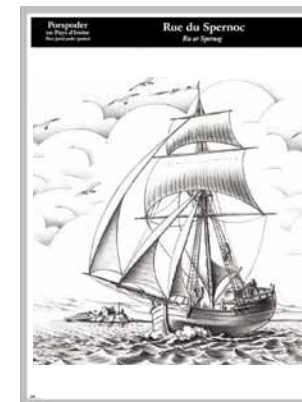
Lave émaillée sur site.

Cette côte sauvage où l'on ressent la vraie force de la nature est un spectacle vivant et authentique, à apprécier sous tous les temps.