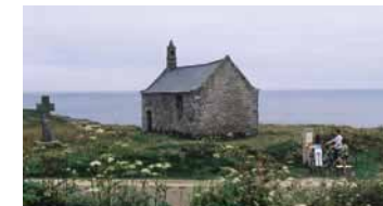
Chapelle Saint Samson