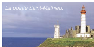
La pointe Saint-Mathieu.

À visiter : le phare, le musée, le cénotaphe, la chapelle et les ruines de l'abbaye.