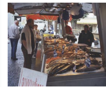
Le samedi à Saint-Renan, marché le plus réputé de la région.