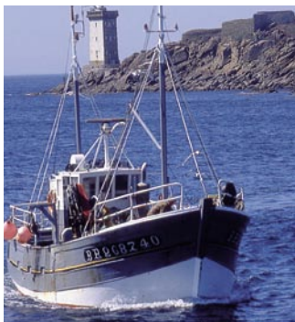
Le port de pêche du Conquet.

Traversez la ria par la passerelle du Croaë, près du château de Cosquiez, pour accéder au Conquet et contemplez ses maisons anciennes du xv e et xvi e siècle, notamment la maison des Seigneurs donnant sur le port de pêche.