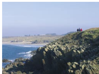
Les Blancs Sablons, vus de la presqu'île de Kermorvan.

Jolie vue sur la plage de sable fin des Blancs Sablons. À la pointe de la presqu'île de Kermorvan, a été érigé en 1923 le phare du même nom. Muni d'un feu clignotant d'une portée de 23 milles et d'un signal sonore (la « corne de brume »), il guide les navires dans le chenal du Four.