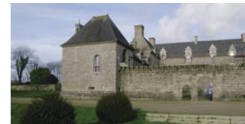
Le château de Kergroadès.

À voir en chemin : le cimetière des saints à Lanrivoaré, le château de Kergroadès à Brélès, la chapelle Saint Éloi à Plouarzel.